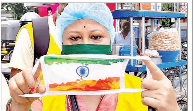
তেরঙ্গা মাস্ক বিক্রি বন্ধে পথে স্বেচ্ছাসেবীরা।